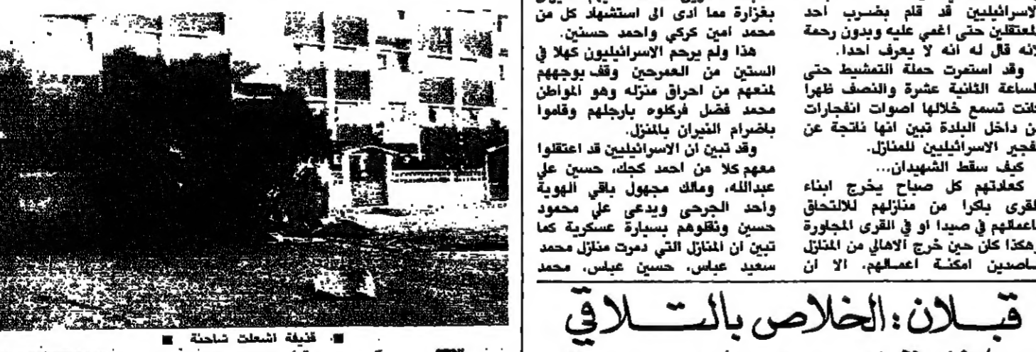
قذائف اشعلت شاحنة السيارة الملوقة في الصرافد

استمر الوضع على حاله امس في منطقة صيدا واستمرت المدينة عرضة للكصف المدفعي وعمليات القصف التي طالت معظم احيائها وشلت الحركة فيها.